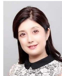
解説：齋藤瑞穂アナ