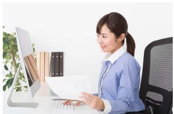
中途採用でテレワークを狙っていくなら断然タイプBです

派遣会社がテレワークの仕事を手に入れてくることは期待できないでしょう。となると テレワークを自社で創出できる企業 を探し当ててホームページなどをこまめにチェックしておくのがよいでしょう。