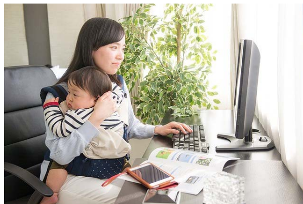
育児者に人気だった在宅が、コロナで全国的に人気職になった

企業にとってテレワークを利用する理由はコロナ禍に起因します。在宅勤務を導入している企業の目的は社員の非出勤なのです。先のタイプAいわゆる社員向けの労働スタイルとして日本企業はテレワークを使っており、中途採用の人材のためにテレワークを導入するという考えの企業は殆どないのです。