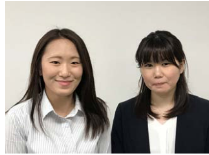
地方会場の成功は現地のアルバイトさんのお手伝いのお陰。

ないように作業の指示をしたり、いかに手短かに分かり易く教えられるかが現地担当者の腕の見せ所です。