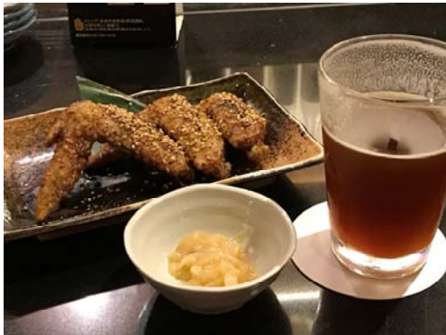
名古屋飯で赤味噌ビール&コーチン手羽先は絶品だと思う。

大阪会場が7/26までだったので、土日を関西で休暇取って大阪-名古屋の連続で仕事をしてきました。結局地方に2週間も出張となりました。