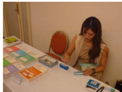
当日現金方式は出席者数と金銭が合わないと焦ります…。

受付で受講料を現金でもらう場合は、お金が合うかどうか確認作業。合っているなら早めに銀行に預け入れてしまうのがいいでしょう。事前に代金を振り込んでもらっている講習会の場合は金銭授受がないので楽ですが、その分本部では事前の入金チェック作業が忙しかったはず。私どもは大体当日現金制で運営していますが、これは欠席・キャンセルの際に返金作業の軽減のためです（中にはキャンセルでも返金しないという講習運営をしている公益法人もあるが、この手のやり方は実際受講者と欠席の際の返金トラブル率が高いので面倒ですよ）。