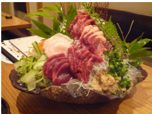
長野名物の馬肉のお刺身でパワーが付いた気がします。

今回初めての開催地だったため少しドキドキしながら会場入り。前日の荷物のチェック、会場の下見はいつも欠かせません。会場の立地、会議室の規模、参加人数等も丁度良く、無事に初開催地での講習会を終えました。真剣な受講者のためにも裏方が頑張らなければならないと思います。