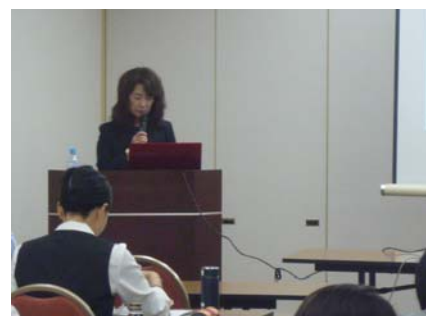
講義中も裏方はのんびりできず人知れず色々作業があります。

無事に講義が終わったら会場の後片付け。講師のお見送り（または慰労会？）も大事なお仕事。17：00頃に終了する講習会が公益法人では一般的なので、大体その日のうちに東京に戻る場合が多いです。今回大阪は翌日から数日間連続の講習だったので、大阪にロングステイしましたが、通常は講習会が終わったら帰京します。