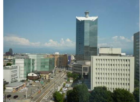
セミの鳴く夏の暑い日の出張は将来いい思い出になります。

長野から移動し、こちら初開催の富山会場。富山のシンボルタワーとも言えるタワービルの中にある会議室で講習会を行いました。外は35℃をこえる猛暑でしたがタワーの中は冷房で快適。テーマが雇用という事で参加されている方の熱意をヒシヒシと感じました。