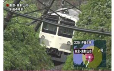
【土砂災害のTVニュース映像】

病み上がりのため実家から通勤しています。東京都の端っこの奥地から新宿まで通勤しています。昨年夏に土砂崩れで電車が埋まり、ちょっとした全国ニュースになりましたが、その時ネットで「どこ!?ジャングルか?」とか「これ秘境の地か?」と言われました。アマゾンの奥地のようなところかもしれませんが