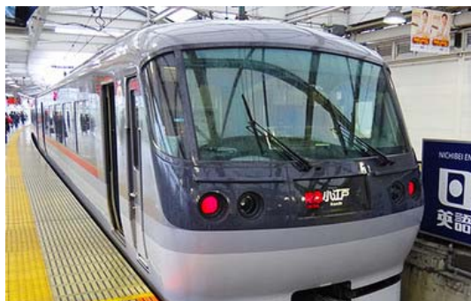
【通勤列車とは思えないほど近代的な性能と装備を備える】

符を予約できて前日に希望の席を取っておけば、100%座れるのです。私の住んでいる駅から西武新宿駅まで20駅あるのですが、この特急だとなんと2駅。50分近い乗車時間が30分にまで短縮されます（特急とは言え途中18駅も飛ばしてよいのかとも思いますが…）。