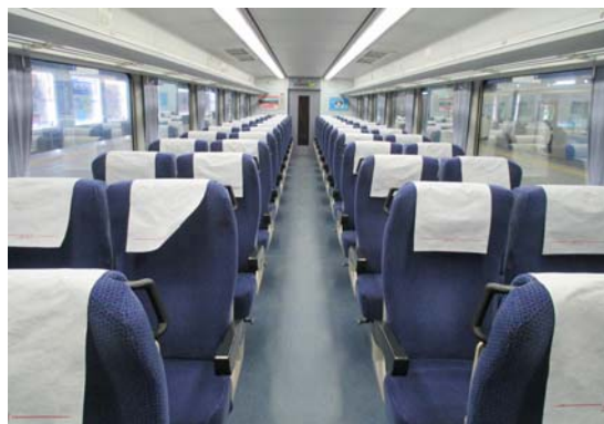
【車内でできることが増えて通勤が楽しくなる？夏場も快適】

毎朝ホームに停車しているレッドアローに乗り込めば自分だけの座席が既に確保されていて、足も組めるゆったり感なので新聞も楽々読めます。私はまずテーブルを出して車窓から景色を眺めながら朝食とコーヒーをゆっくり取り、食後はPCでメールチェック、その後エアコンの利いた車内で横になって映画やTVを見ながら出勤しています。まさにラッシュ時間にこんな贅沢な通勤ができるなんて想像できますか？しかも驚くほど騒音なし揺れなしの近代列車で化粧室・WC・授乳室・自動販売機・Wi-Fiなど装備も充実。なんて夢のようなんでしょう。こんなVIP待遇がたったの400円なら利用しない手はないですね（欲を言えば食堂車が欲しいところ）。通勤ラッシュで満員御礼の普通列車の横を追い抜く時にはなんだか申し訳ない気分さえあります。