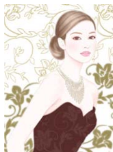
(オフィスタ登録可)

ハケンに品格が求められるのは何故かということ、スタッフ1人1人がオフィスタの顔だからです。勤務先と一緒に働くスタッフを見て、「オフィスタは良い会社だな」とか「オフィスタはダメな会社だな」と判断するわけですから、 オフィスタの看板を背負っている以上は品位・品格が絶対的に求められる というわけです。問題は自身でそれに気が付くかどうかです。女性は年齢とともに凶々しくなりがちなのはみなさまもご存じの通りだと思いますが、例えば「貴方はマダムですか？オバちゃんですか？」と問われたらどう答えますか。このように第三者的な視点から時には自分を見つめ直してみる修練も必要だと思います。品格にこだわりをもっているからこそオフィスタを信用してくださる企業・取引先がいっぱいあるのだと常に自負しておりますので、その信頼を裏切らないように今後もスタッフの方々には品格を追求していただきたいと思います。品性・品格をもった社会に必要とされる人間を目指していきましょう。