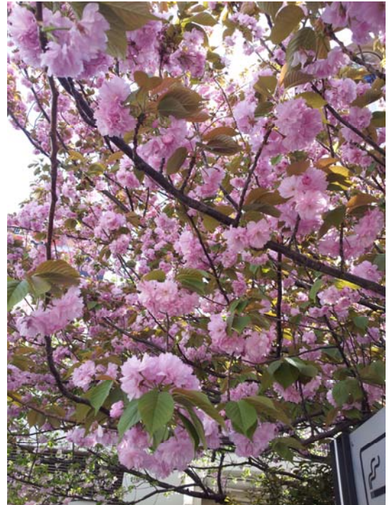
（このサクラはなんでしょう!?!）

今年は桜の開花が早かったので、もう終わりか〜と思いつつ後樂園の方を歩いていたら満開の桜を発見。どう見てもソメイヨシノでもなさそうだし、う〜ん、この桜は一体どんな品種なんだろう？・・・ということで、デジカメでパシャ！と撮ってみました。