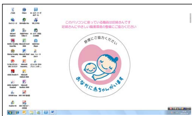
(パソコン・デスクトップのイメージ写真)

いまや各自職場の机上に PC があるのは珍しくありませんし、モニター画面も大型化してきています。事務職であれば勤務中の必需品です。PC 画面なら大きく目につきやすく、且つシール等のように会社の備品を汚すこともなく、普及にあたって作成費用が1円もかからない等のメリットがあるので、オフィスタでは「職場内でのマタニティマーク表示 PC 壁紙」を企画してみました。