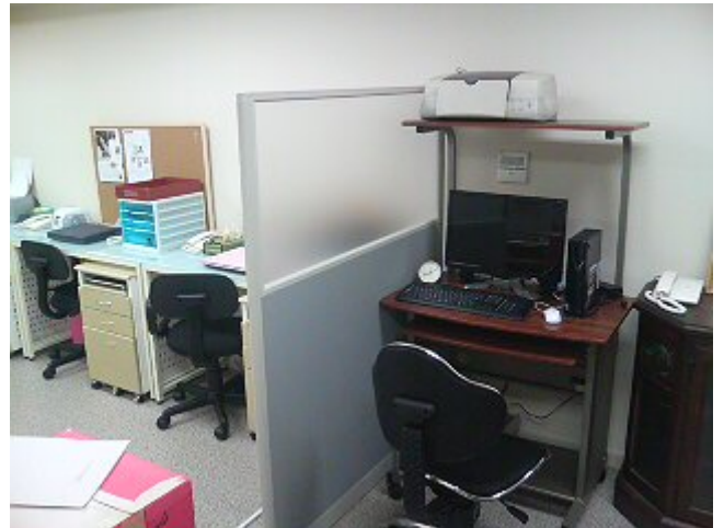
(↑PC 研修プログラムもありますのでご利用ください)

8F 新フロアは4月1日よりオープンし、PC 研修設備の導入やお仕事相談窓口を設置し、更にスタッフのみなさまにもやさしいオフィスとして開放していければと考えています。