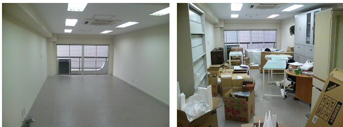
(↑新たなオフィスもあつという間にこのありさまで)

たったいくつかの部署が上階に移るだけでこんなに大変だとは思いませんでした。これが全員、別の場所にあるビルに移転などと考えると少々ゾッとします。一時は足の踏み場もなかった我が職場もやっと落ち着いてきてホッとしています。